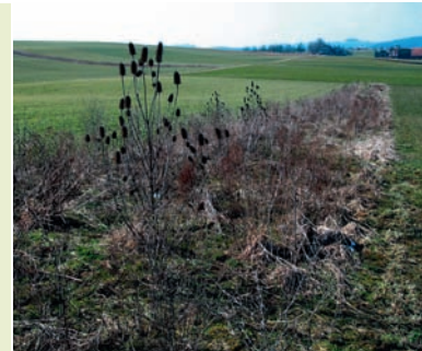
Buntbrache im Winter – eine wichtige Nahrungsquelle