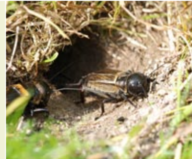
Feldgrille vor ihrer Erdhöhle