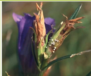
Eier an Enzianblüten