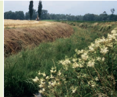
Typischer Lebensraum der Bachufer-Beisschrecke