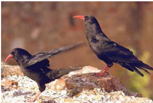
Siegrist + Zuber