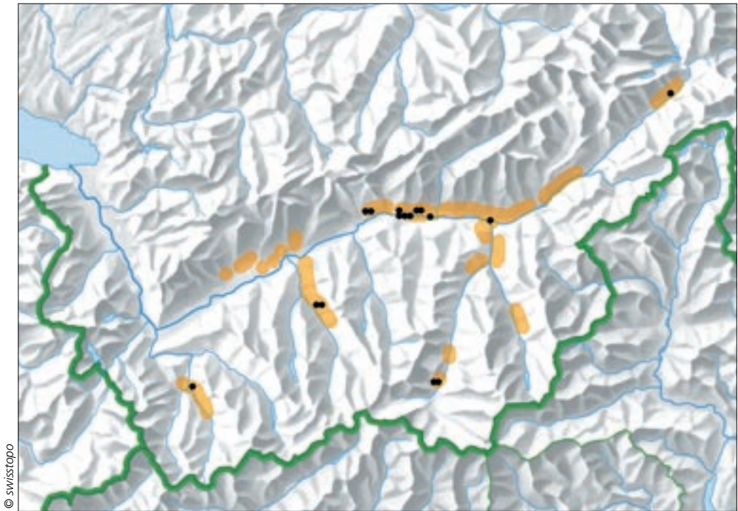
Fig. 3 – Répartition des 32 territoires (en 16 carrés kilométriques, points noirs) de Bruant ortolan Emberiza hortulana dénombrés en Valais en 2004. Le secteur de prospection, déterminé d'après les mentions récentes (1993-2003), est figuré en orangé.

Chaque recensement a mobilisé deux observateurs, qui ont parcouru une moitié de zone chacun, permettant de ce fait une couverture totale de ce secteur particulièrement pentu (pente moyenne d'environ 30°).