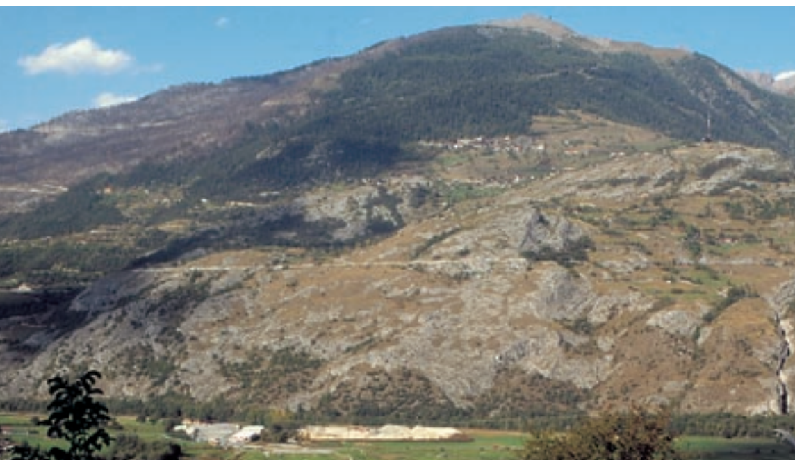
Coteau de Loèche en 1983, entre le Feschelbach et La Souste, quatre ans après le passage du feu. Au moins 29 territoires d'Ortolans Emberiza hortulana y ont été dénombrés cette année-là (par méthode de capture-recapture des individus bagués), essentiellement sur la partie basse du coteau.