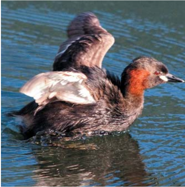
Il Tuffetto Tachybaptus ruficollis è una nuova specie entrata nella Lista Rossa.

sono state elaborati i primi cinque piani d'azione nazionali. (UFAM 2008): nel 2008 per il Gallo cedrone (Mollet et al. 2008) e il Picchio rosso mezzano (Pasinelli et al. 2008) e, nuovo, nel 2010 per Cicogna bianca (Kestenholz et al. 2010), Piro piro piccolo (Schmid et al. 2010) e Upupa (Mühlethaler et al. 2010). Quest'anno sono in corso le trattative tra Confederazione e cantoni nell'ambito della NPC. È importante che siano considerate nei contratti le misure di promozione per la conservazione dell'avifauna.