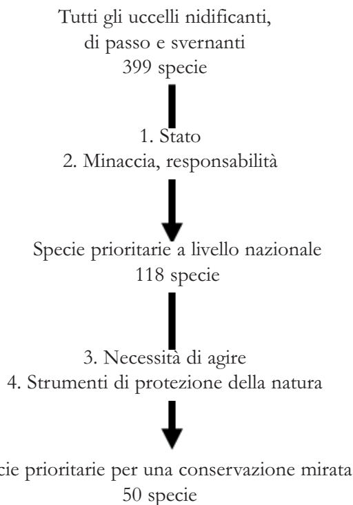
Fig. 1. I quattro passi per la definizione delle Liste prioritarie attraverso i criteri utilizzati come filtri.

Il Merlo dal collare Turdus torquatus predilige gli spazi aperti al limite del bosco. Gli effetti dell'abbandono degli alpeggi si sommano a quelli del riscaldamento climatico e la specie è passata da "non minacciata" alla categoria "vulnerabile" della Lista Rossa. La specie sta diminuendo e la diminuzione è maggiore al di sotto dei 1500 metri.