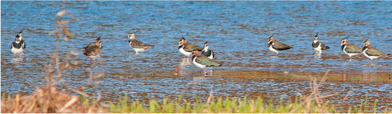
Gli effettivi della Pavoncella Vanellus vanellus sono fortemente diminuiti negli ultimi dieci anni. La specie è ora classificata come “minacciata di estinzione”.

zione della caccia affinché possano essere salvaguardati gli effettivi di questa specie per la quale la Svizzera ha una grande responsabilità. Il Balestruccio dipende da misure di protezione specifiche nelle aree urbane.