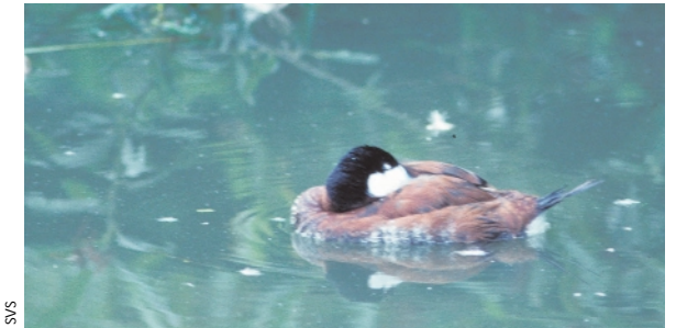
Die Ruhe für eingeführte Schwarzkopfruderenten in Europa ist zu Ende. Ein internationaler Aktionsplan fordert deren vollständige Eliminierung.

Da es sich bei der Schwarzkopfruderente nicht um eine einheimische Art handelt, ist eine Haltung ohne Bewilligung möglich. Dies vergrössert zusätzlich zu den einwandernden Tieren das Risiko, dass weitere Tiere in die freie Wildbahn gelangen.