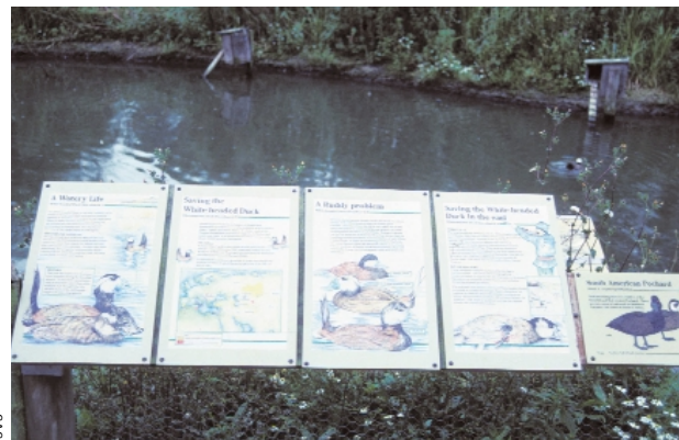
Die vor allem in Spanien Probleme verursachenden amerikanischen Schwarzkopfruderenten wurden Ende der 1940er-Jahre in England eingeführt und in Vogelparks als Ziervogel verwendet.

Nachdem die Biotopmassnahmen zu greifen begonnen haben, ist die Weisskopfruderente nun erneut vom Aussterben bedroht. Die Hybridisierung geht soweit, dass bereits Hybriden der 2. und 3. Generation bekannt sind (Bilder siehe Titel). Massnahmen, um die Weisskopfruderente vor dieser Vermischung mit der Schwarzkopfruderente zu schützen, sind daher dringend.