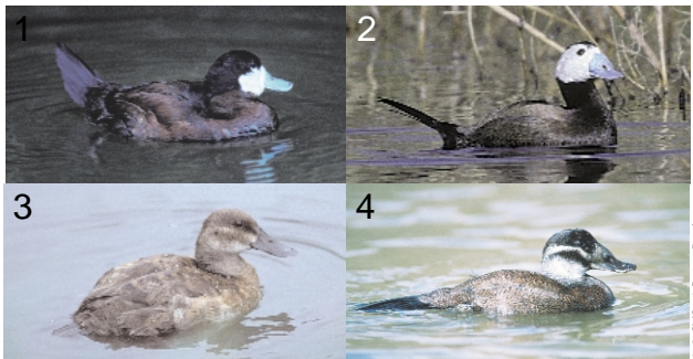
1-3: SVS, 4: Peter Buchner 1: Männchen Schwarzkopfruderente im Prachtkleid, 2: Männchen Weisskopfruderente im Prachtkleid; 3: Weibchen der Schwarzkopfruderente; 4: Weibchen der Weisskopfruderente

Die amerikanische Schwarzkopfruderente ist oftmals schwer von der nahe verwandten europäischen Weisskopfruderente zu unterscheiden. Am besten gelingt dies bei den Männchen im Prachtkleid: Bei der Schwarzkopfruderente ist der Kopf abgesehen von der weissen Wange schwarz, bei der Weisskopfruderente ist er hauptsächlich weiss. Generell hat die amerikanische Ruderente einen relativ kleinen und "eckigen" Kopf. Der Oberschnabelfirst ist konkav und die Schnabelbasis ist nicht geschwollen wie bei der Weisskopfruderente. Die letzten beiden Merkmale helfen insbesondere bei der Bestimmung von Weibchen und Jungtieren (s. Bilder).