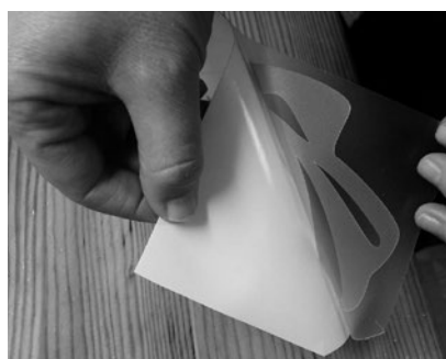
3. Staccare dalla carta