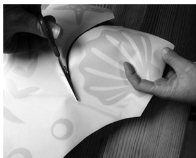
1. Ritagliare il motivo

(Attenzione: temperatura minima per il montaggio +10°C)