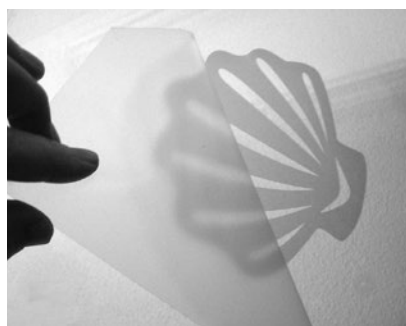
5. Togliere la lamina di trasferimento

Gli autocollanti più grandi vanno applicati di preferenza bagnati, in maniera che non si formino bolle d'aria.