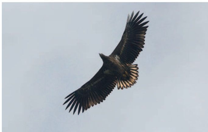
Abb. 3. Seeadler Haliaeetus albicilla 1.KJ. Galfer/Grabs SG, 8. Oktober 2007. M. Ruppen. – White-tailed Eagle Haliaeetus albicilla 1 st cy. Galfer/Grabs (canton of St. Gallen), 8 October 2007.

– Dent de Lys/Albeuve, 7. Juli, 2 Ind., Foto (J.-C. Monney).