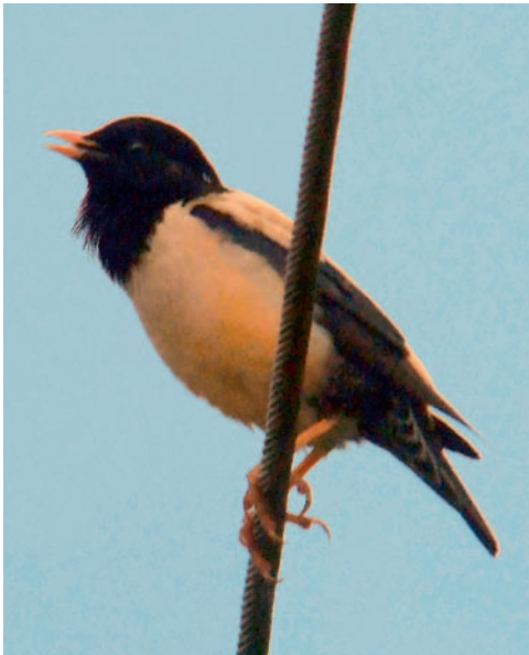
Abb. 16. Rosenstar Sturnus roseus ♂ ad. singend. Pizzante/Locarno TI, 1. Mai 2007. – Rosy Starling Sturnus roseus singing ad. ♂. Pizzante/Locarno (Ticino), 1 May 2007.

Die meisten Beobachtungen stammen aus dem Juni, der Nachweis aus dem Kanton Freiburg