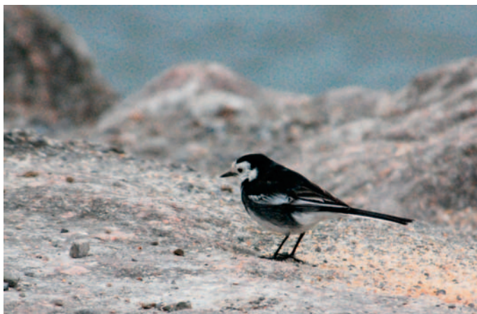
Abb. 13. Trauerbachstelze Motacilla alba yarrellii ♂ ad. Flachsee Unterlunkhofen AG, 25. Dezember 2007. – Pied Wag-tail Motacilla alba yarrellii ad. ♂. Flachsee Unterlunkhofen (canton of Aargau), 25 December 2007.

2. März 2008, ♂ ad., Foto, Video, Abb. 13 (H. P. Ammann, M. Labreuche et al.). VD – Yverdon, 6. März (E. Morard). Die Trauerbachstelze überwintert von den Britischen Inseln über Westfrankreich und der Iberischen Halbinsel bis nach Südmarokko. Die Überwinterung am Flachsee Unterlunkhofen ist die erste für die Schweiz und die angrenzenden Gebiete und steht vermutlich im Zusammenhang mit dem bei uns immer milderen Winterklima.