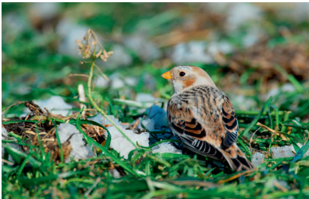
Abb. 17. Schneeammer Plectrophenax nivalis . Untervaz GR, 30. Januar 2007. C. Meier-Zwicky. – Snow Bunting Plectrophenax nivalis . Untervaz (Grisons), 30 January 2007.

Arten, die möglicherweise, jedoch nicht mit Sicherheit aus der freien Wildbahn stammen oder