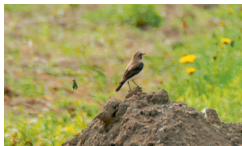
Abb. 14. Mittelmeersteinschmätzer Oenanthe hispanica ♀ dunkelkehlig. Maggiadelta TI, 21. April 2007. K. Koch. – Black-eared Wheatear Oenanthe hispanica dark-throated ♀. Maggia delta (Ticino), 21 April 2007.

Der Steinrötel überwintert hauptsächlich in Afrika südlich der Sahara und erscheint bei uns