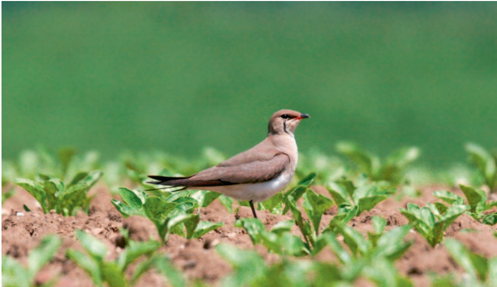
Abb. 8. Rotflügelbrachschnalbe Glareola pratincola . Grandcour VD, 27. April 2007. – Collared Pratincole Glareola pratincola . Grandcour (canton of Vaud), 27 April 2007.