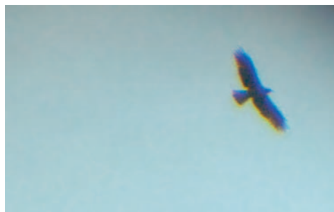
Abb. 6. Zwergadler Hieraetus pennatus mind. 3.KJ dunkle Morphe. Fanel BE, 3. Juni 2007. J. Mazenauer. – Booted Eagle Hieraetus pennatus at least 3 rd cy dark morph. Fanel (canton of Berne), 3 June 2007.

Der Graubruststrandläufer ist die in der Schweiz und in Westeuropa am häufigsten beobachtete nearktische Limikolenart (Dubois & Luczak 2004). Dies kann wahrscheinlich dadurch erklärt werden, dass die Art ihr Brutgebiet in letzter Zeit von der Nearktis aus nach Sibirien ausgebreitet hat – seit den Achtzigerjahren wird sogar ein Brüten im europäischen Teil Russlands vermutet (Hagemeijer & Blair 1997) – und sich als Folge davon die Zugrouten verschoben haben (Lees & Gilroy 2004). Im Verlauf der letzten 10 Jahre fehlte der Graubruststrandläufer bei uns nur 2002, 2005 und 2006.