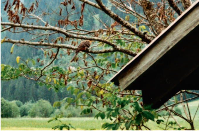
Abb. 11. Häherkuckuck Clamator glandarius juv. Lauenen BE, ca. 20. Juli 2007. – Great Spotted Cuckoo Clamator glandarius juv. Lauenen (canton of Berne), around 20 July 2007.

Seit 1960 liegen nur acht Dezemberrachweise vor; der Hauptdurchzug findet im Herbst im September statt (Maumary et al. 2007).