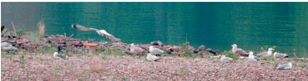
Abb. 9. Korallenmöwe Larus audouinii ad. (Mitte) und Mittelmeermöwen L. michahellis . Reussdelta UR, 7. Mai 2007. – Audouin's Gull Larus audouinii ad. (centre) with Yellow-legged Gulls L. michahellis . Reuss delta (canton of Uri), 7 May 2007.

Dieser fünfte Nachweis für die Schweiz ist umso erstaunlicher, weil er von einem See in