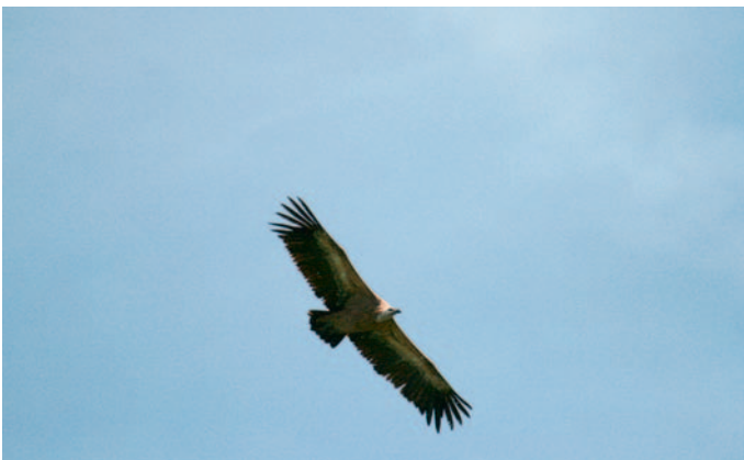
Abb. 5. Gänsegeier Gyps fulvus 2.KJ. Le Larzey/Sembrancher VS, 23. Juni 2007. M. Martinez. – Griffon Vulture Gyps fulvus 2 nd cy. Sembrancher (Valais), 23 June 2007.

UR – Reussdelta, 28. November – 14. Dezember, 1.KJ, Foto (T. Gnos-Lötscher).