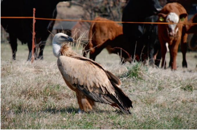
Abb. 4. Gänsegeier Gyps fulvus immat. Savièse VS, 7. April 2007. Y. Biselx. – Griffon Vulture Gyps fulvus immat. Savièse (Valais), 7 April 2007.

allem von Maikäfern in einer landwirtschaftlich genutzten Ebene, welche regelmässig mediterrane Irrgäste anzieht.