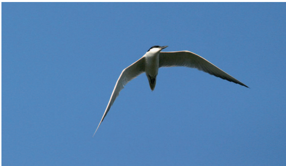
Abb. 10. Lachseeschwalbe Sterna nilotica ad. Chavornay VD, 14. Juli 2007. F. Jaquier. – Gull-billed Tern Sterna nilotica ad. Chavornay (canton of Vaud), 14 July 2007.

einem Alpental der Zentralschweiz stammt. Der Vogel machte nur eine kurze Rast mitten in einer Kolonie von Mittelmeermöwen Larus michahellis .