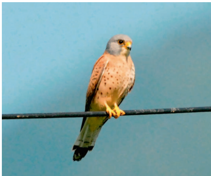
Abb. 7. Rötelfalke Falco naumanni ♂ 2.KJ Sant'Antonino TI, 19. Mai 2007. – Lesser Kestrel Falco naumanni 2 nd cy ♂. Sant'Antonino (Ticino), 19 May 2007.

Fünfter Nachweis in der Schweiz seit 1900. Dieser Meerstrandläufer machte nur einen kurzen Halt an einem traditionellen Limikolenrastplatz. Die Feststellung gelang nur ein Jahr nach der letzten Beobachtung von 2006 in Genf (E. Broch et al. in Schweizer 2007). November