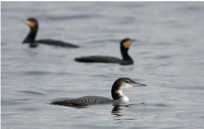
Abb. 2. Eistaucher Gavia immer 1.KJ mit zwei Kormoranen Phalacrocorax carbo im Hintergrund. Birrwil AG, 16. Dezember 2007. B. Rüegger. – Great Northern Loon Gavia immer 1 st cy with two Great Cormorants Phalacrocorax carbo in the background. Birrwil (canton of Aargau), 16 December 2007.