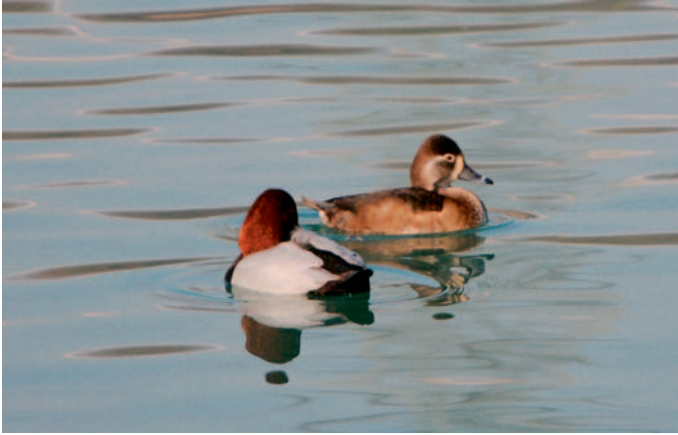
Abb. 1. Ringschnabelente Aythya collaris ♀ (rechts) mit Tafelente A. ferina ♂ (links). Verbois GE, 25. Februar 2008. A. Chapuis. – Ring-necked Duck Aythya collaris ♀ (right) with Tufted Duck A. ferina ♂ (left). Verbois (canton of Geneva), 25 February 2008.

TG – Ergänzung : Kesswil und Uttwil, 3.–11./14./23. Dezember 2006, 5./7.–13. Januar, 14./17. Februar und 8.–26. April 2007, 1 ad., Foto (M. Schulz et al.), 6. Januar 2007, 2 Ind. (A. & P. J. Brändli et al.).