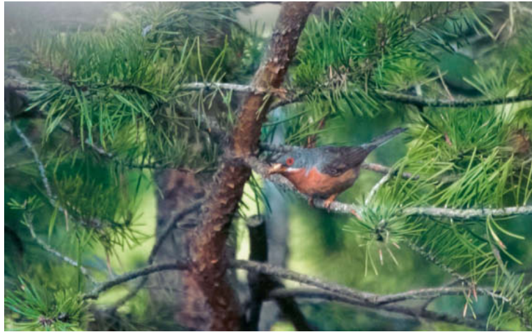
Abb. 5. Weissbartgrasmücken-♂ Sylvia cantillans mit Futter für die Flügglinge. Mittelwallis, 4. August 2014. A. Jacot. – Male Subalpine Warbler Sylvia cantillans with food for the fledglings. Central Valais, 4 August 2014.

eine Brutzeitbeobachtung im Churer Rheintal (U. Bühler, S. Werner) sowie ein Revier und eine Brutzeitfeststellung im Prättigau (U. Bühler). Auf eine Ausdehnung des Areals oder bisher unentdeckte Vorkommen weisen ein trommelndes ♂ während der Brutzeit im Kanton Schwyz (T. Bonnet in Marques & Thoma 2015) sowie zwei Beobachtungen knapp ausserhalb der Brutzeit im Oberhalbstein GR und im Sarganserland SG hin (P. & B. Giacometti, A. Good in Marques & Thoma 2015).