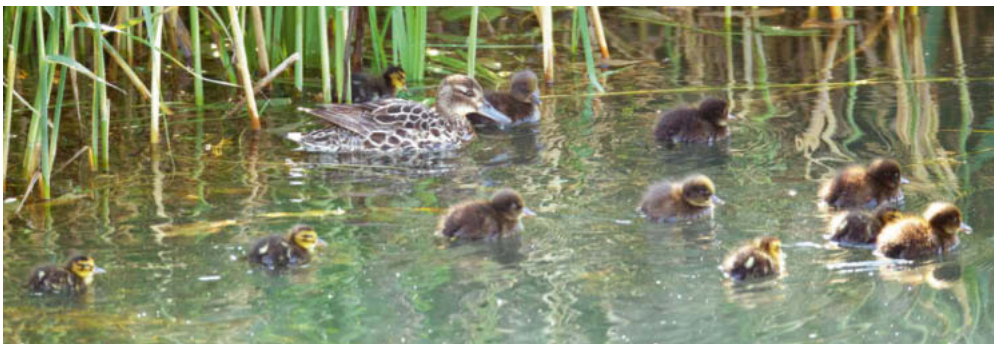
Abb. 2. Knäkenten-♀ Anas querquedula mit 5 eigenen und 6 Reiherentenpull. Aythya fuligula . Kaltbrunner Riet SG, 28. Juni 2014. K. Robin. – Female Garganey Anas querquedula with five own chicks and six chicks of Tufted Duck Aythya fuligula . Kaltbrunner Riet (canton of St. Gallen), 28 June 2014.

An den langjährig besetzten Brutgewässern Wichelsee OW, Eglisauer Stau ZH und Zürich-Obersee wurden 6 Familien gefunden (Mittel 2009–2013: 8 Bruten an 5 Orten).