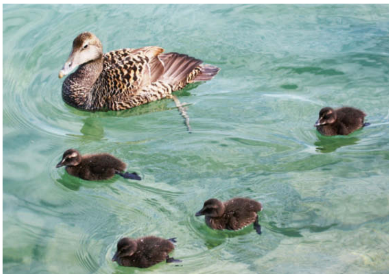
Abb. 3. Eiderenten-♀ Somateria mollissima mit 4 pull., eine der 4 Familien am Zürich-Obersee. Freienbach SZ, 3. Juni 2014. – Female Common Eider Somateria mollissima with four chicks, one of the four families on upper Lake Zurich. Freienbach (canton of Schwyz), 3 June 2014.