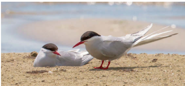
Abb. 4. Das Paar der Küstenseeschwalbe Sterna paradisaea am Nest auf der Sandbank, der eine ad. am Bebrüten des ersten Geleges (oben). Ein ad. bei der Nistmulde mit 2 Eiern (unten). Chablais de Cudrefin VD, 15. Juni 2014. – The pair of Arctic Tern Sterna paradisaea on the nest on the sandbank, one of the adults incubating the first clutch (above). One of the adults on the nest depression with two eggs (below). Chablais de Cudrefin (Vaud), 15 June 2014.

Der Brutbestand war mit 583 BP in 17 Kolonien im Bereich der Vorjahre (Mittel 2009–2013: 623 BP in 18 Kolonien). Die Orte und Grössen der Kolonien blieben über die Jahre ziemlich konstant. Bei folgenden Kolonien gab es Änderungen: Auf dem Floss von Pointe-à-la-Bise GE am unteren Genfersee gab es keine Bruten, da dieses durch ein Paar Mittelmeer-möwen besetzt war (D. Landenbergue, H. Candolfi). Erstmals seit 2005 gab es wieder eine Brut auf dem Floss Chlisee am Südufer des