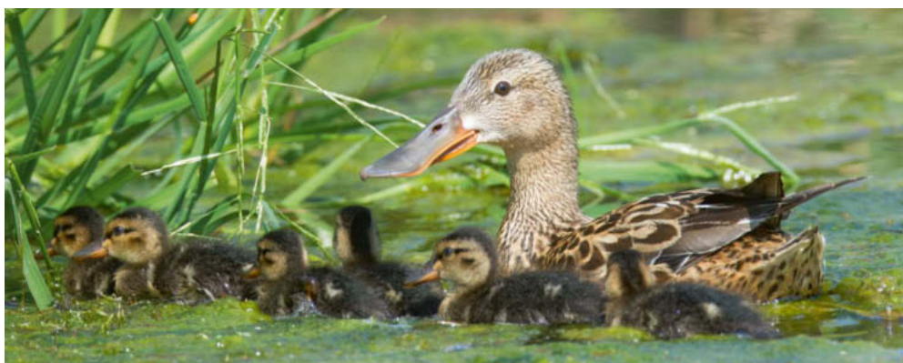
Abb. 1. Löffelenten-♀ Anas clypeata mit 6 pull. Kaltbrunner Riet SG, 16. Juni 2014. – Female Northern Shoveler Anas clypeata with six chicks. Kaltbrunner Riet (canton of St. Gallen), 16 June 2014.

6 Brutnachweise an 3 Orten (Mittel 2009–2013: 7 Bruten an 3 Orten): 1 Fam. mit 2 pull. am Südufer des Neuenburgersees (AGC, P. Rapin), 4 Fam. mit insgesamt 21 pull. am Klingnauer Stausee AG (E. Weiss u.a.) und 1 Fam.