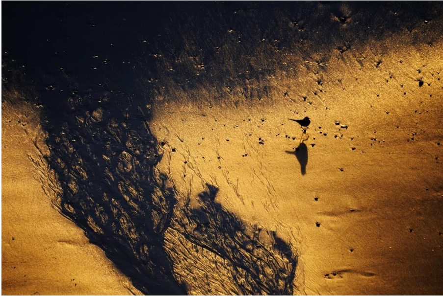
1. Rang Kategorie „Emotion“: Im Spiel von goldenem Licht und schwarzem Schatten erscheint die Bachstelze gleichzeitig abstrakt und harmonisch.