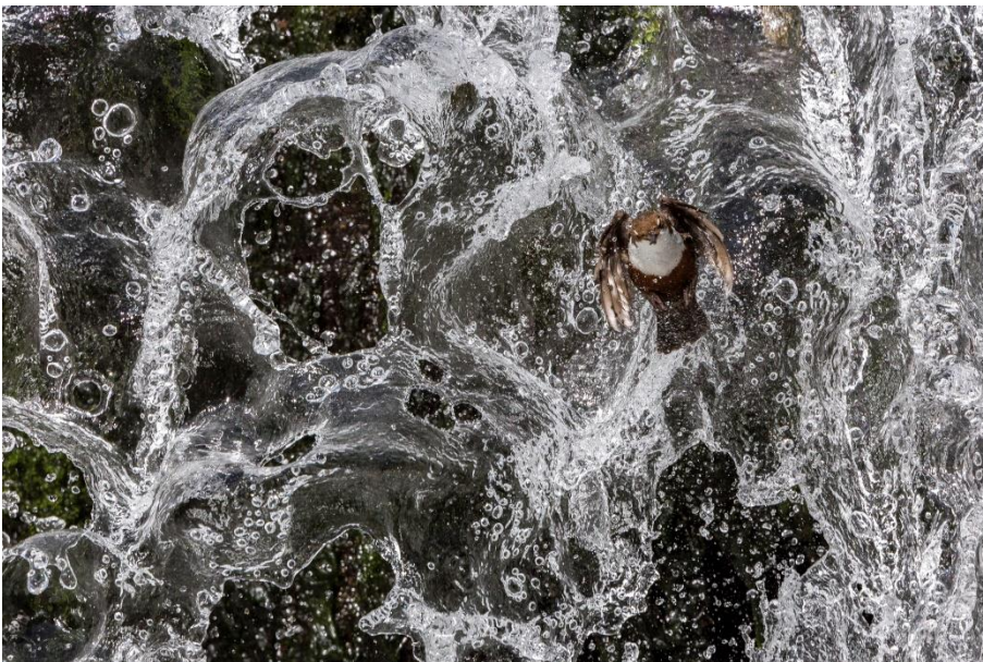
1 er place de la catégorie « Action » : Claudio Comi a saisi ce cicle plongeur juste au moment où il traversait la chute d'eau.