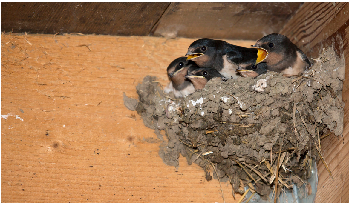
Fig. 3. Jeunes hirondelles rustiques dans un nid naturel à l'intérieur d'une étable. Ce type d'emplacement est typique pour l'espèce.

dans le bâtiment peut être comptée comme preuve de nidification.