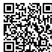
Code d'honneur de la FSDC

Cette brochure a été réalisée en collaboration avec les partenaires suivants : BirdLife Suisse, Office fédéral de l'environnement (OFEV), Office fédéral de l'aviation civile (OFAC), ChasseSuisse, Conférence des services de la faune, de la chasse et de la pêche (CSF), Conférence des délégués à la protection de la nature et du paysage (CDPNP), Pro Natura, Fédération Suisse des Drones Civils (FSDC), Station ornithologique suisse de Sempach.