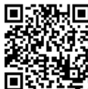
Papillon de l'OFAC