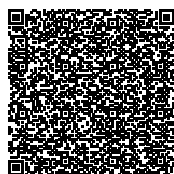
Carte des restrictions de vol

Les cantons peuvent délimiter des zones d'interdiction de vol pour les drones.