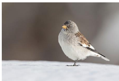
Die vier Sperlingsarten der Schweiz (im Uhrzeigersinn): Haussperling, Italiensperling, Schnee- und Feldsperling.

Stiftung Schweizerische Vogelwarte Fondation Station ornithologique suisse Fondazione Stazione ornitologica svizzera Fundaziun Staziun ornitologica svizra Foundation Swiss Ornithological Institute